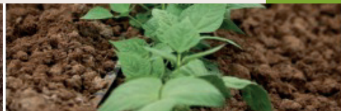
25 a 30 dds (días después de la siembra)