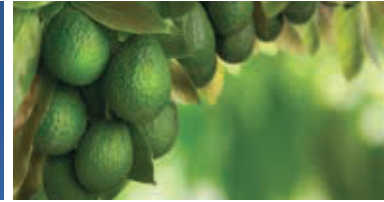
Llenado de fruto